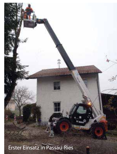
Erster Einsatz in Passau-Ries