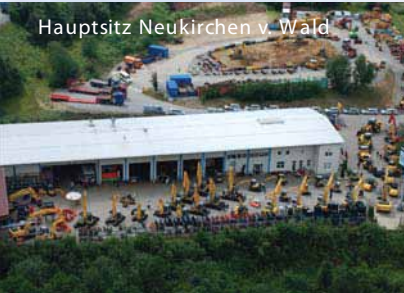
Hauptsitz Neukirchen v. Wald